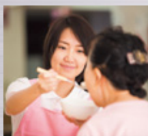
デイサービス 老人ホーム